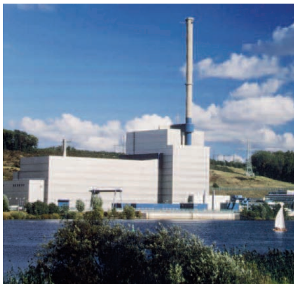
El till konkurrenskraftiga priser kan levereras från kärnkraft, menar en rad industriföretag som slutit sig samman i Industrikraft i Sverige AB.